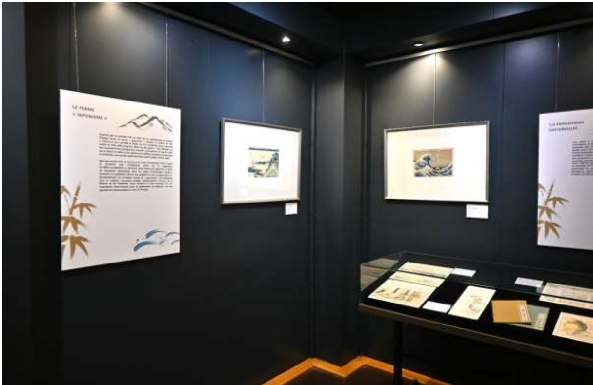
Exposition « Rêves de Japon » au Château de Waroux - Liège