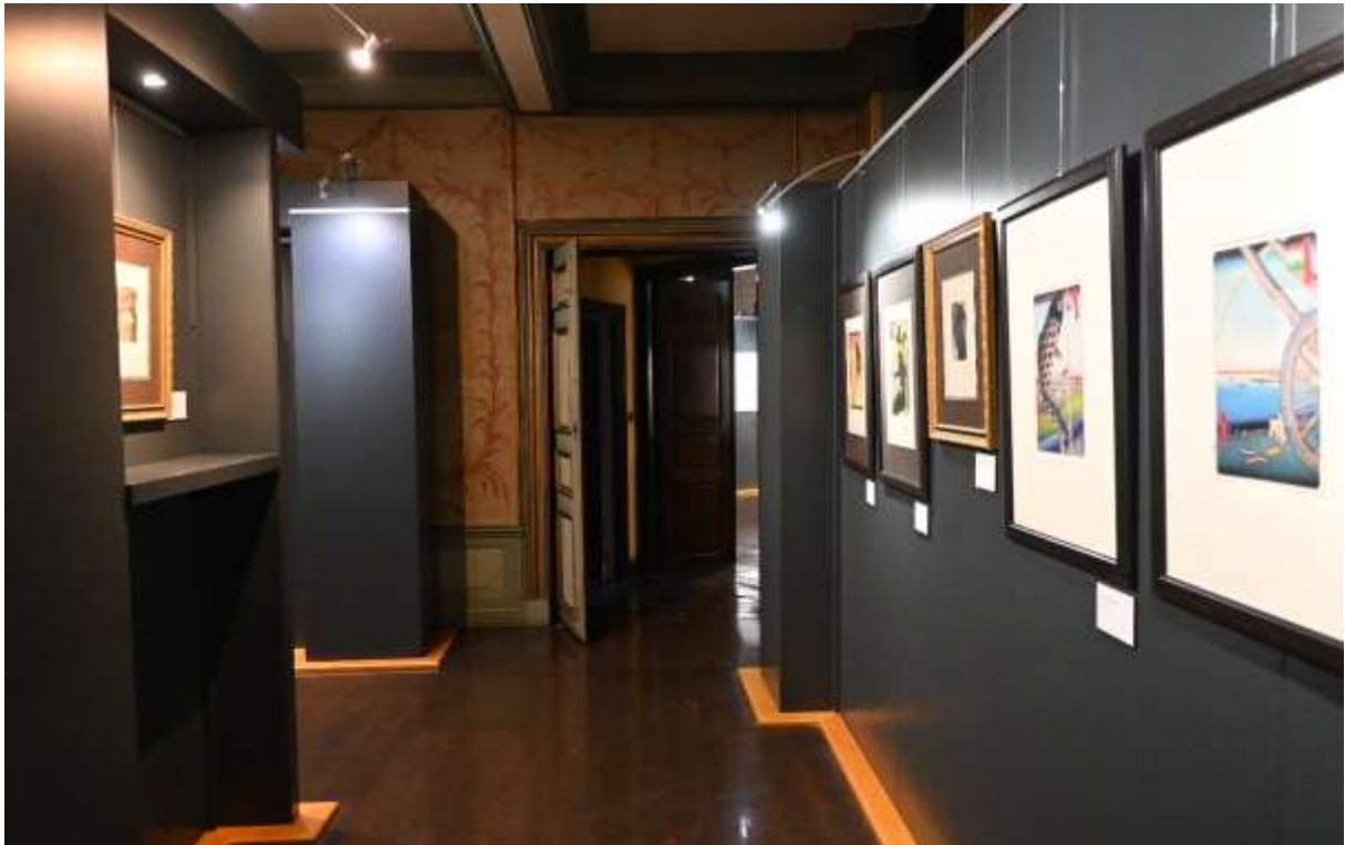
Exposition « Rêves de Japon » au Château de Waroux - Liège