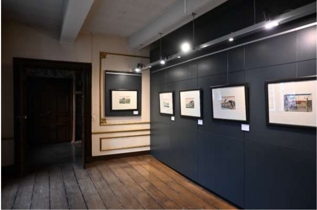
Exposition « Rêves de Japon » au Château de Waroux - Liège