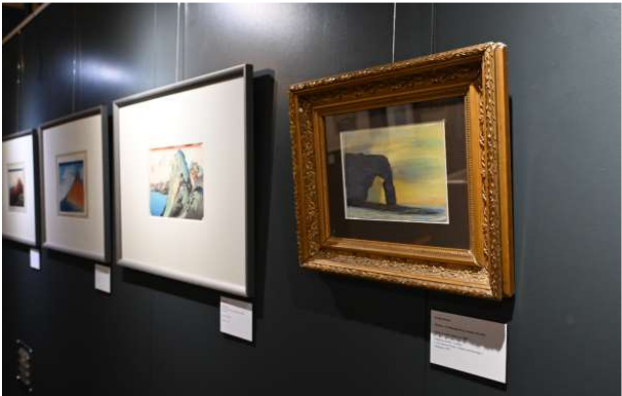
Exposition « Rêves de Japon » au Château de Waroux - Liège