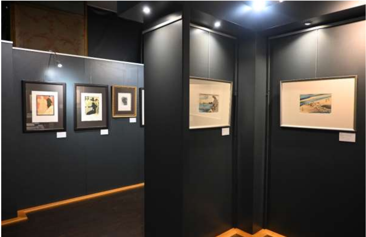
Exposition « Rêves de Japon » au Château de Waroux - Liège