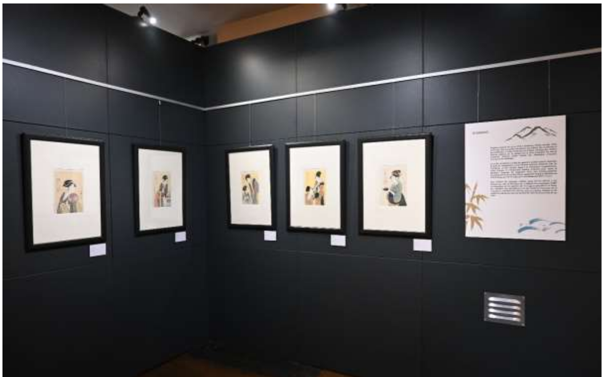
Exposition « Rêves de Japon » au Château de Waroux - Liège