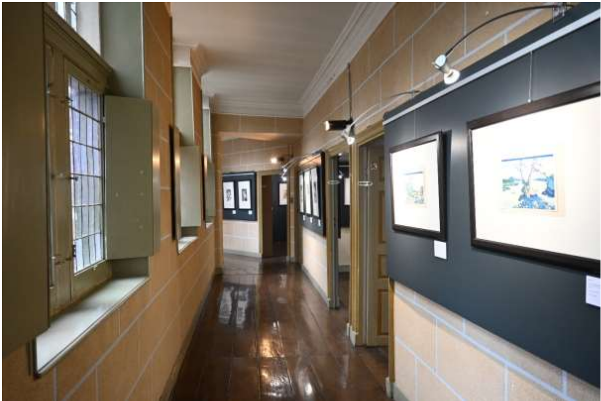
Exposition « Rêves de Japon » au Château de Waroux - Liège