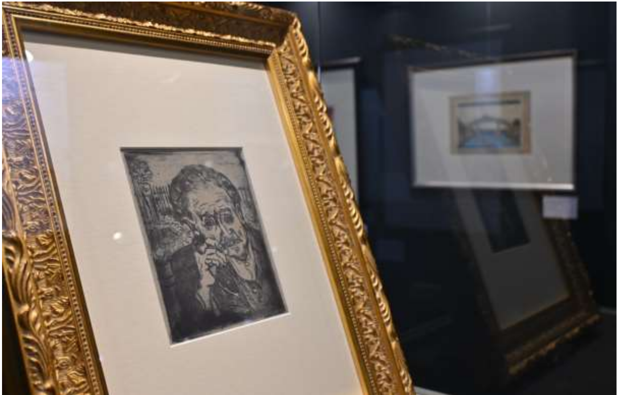
Exposition « Rêves de Japon » au Château de Waroux - Liège